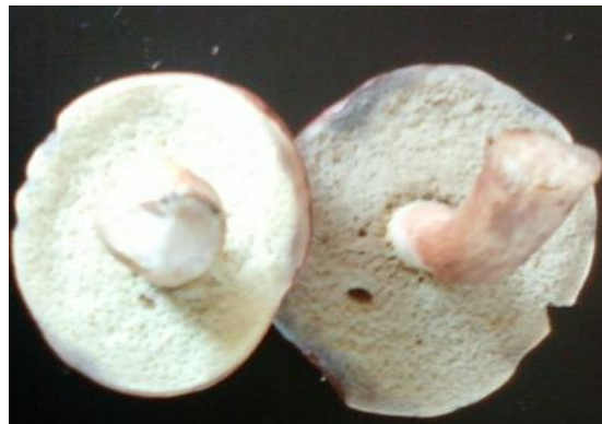
Bolet bai dessous