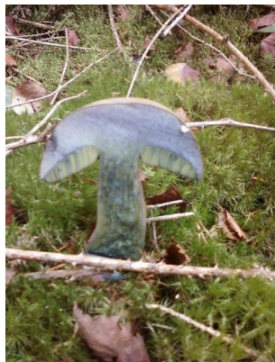
Bolet bai coupé